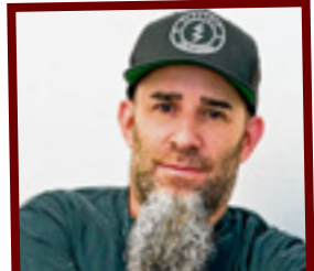
Scott Ian erzählt die lustigsten Geschichten aus 30 Jahren Rock-Erfahrung

Bochum - Wenn Scott Ian (51) normalerweise auf der Bühne steht, brauchen seine Zuschauer Ohrstöpsel. Der Amerikaner ist Gitarrist und Mitbegründer der legendären Heavy Metal-Band „Anthrax“. Doch jetzt kommt er mit ruhigeren