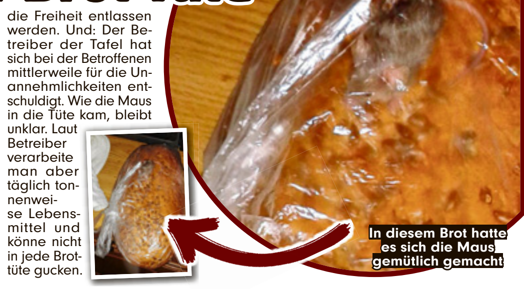
In diesem Brot hatte es sich die Maus gemütlich gemacht

Duisburg - Mausgerechnet eine Brottüte... hat sich dieser kleine Nager als Schlafplatz ausgesucht... Blöd nur, dass die dann in der Lebensmittelausgabe einer Tafel in Duisburg gelandet ist - mit samt der Maus! Eine Kundin (24) nahm das Körnerbrot mit und fand das Tierchen später zu Hause. Die gute Nachricht: Die Feldmaus hat den Aufenthalt in der Plastiktüte gut überstanden und konnte lebend in die Freiheit entlassen werden. Und: Der Betreiber der Tafel hat sich bei der Betroffenen mittlerweile für die Unannehmlichkeiten entschuldigt. Wie die Maus in die Tüte kam, bleibt unklar. Laut Betreiber verarbeitet man aber täglich tonnenweise Lebensmittel und könne nicht in jede Brottüte gucken.