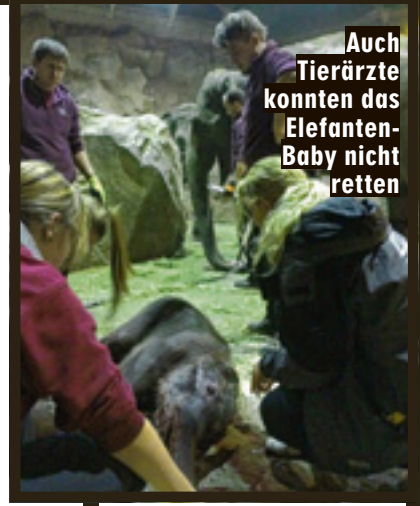
Auch Tierärzte konnten das Elefanten-Baby nicht retten

Münster - Trauer im Allwetterzoo Münster. Elefantendame Corynne hatte am Mittwoch ein Elefantenkalb zur Welt gebracht. Leider verstarb der 10 Kilo schwere weibliche „Babyfant“ während der Geburt.